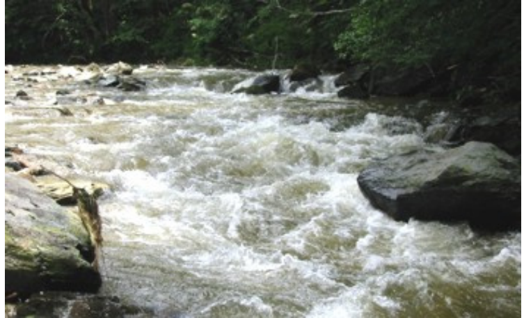
Würzige Stelle im "60er Bogen"

Im Oberlauf zählt die Feistritz nicht unbedingt zu den bei Paddlern bekannteren Flüssen, dementsprechend wird sie auch eher selten besucht. Der hier vorgestellte Abschnitt zwischen Fischbacher Bahnhof und Riedlmüller Stausee ist zwar nicht besonders lang aber recht abwechslungsreich, ruhigere Abschnitte mit typischen Kleinflusshindernissen (Baum- u. Strauchhindernisse) und anspruchsvollere verblockte Passagen wechseln einander ab.