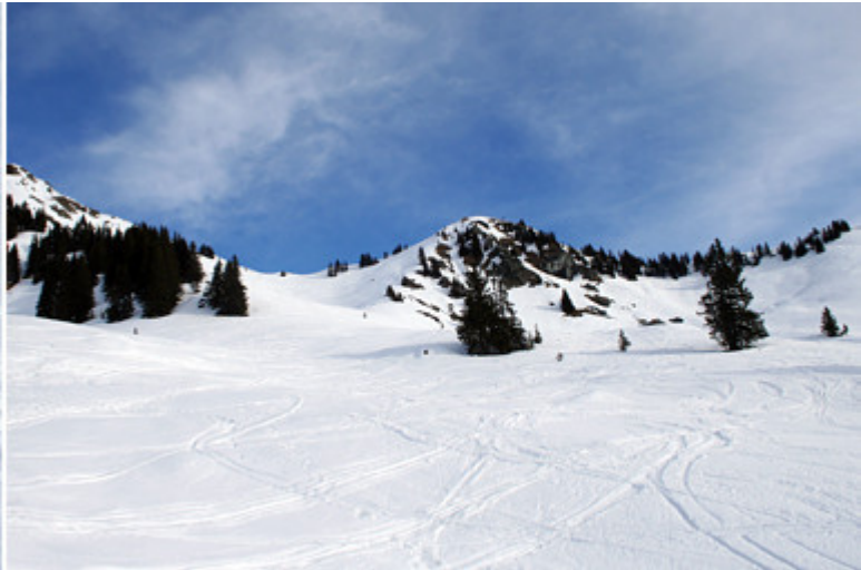
Gerade noch sichtbar: der Wegweiser oberhalb der Alm (li.) - Blick auf die letzten 200 Höhenmeter (re.)