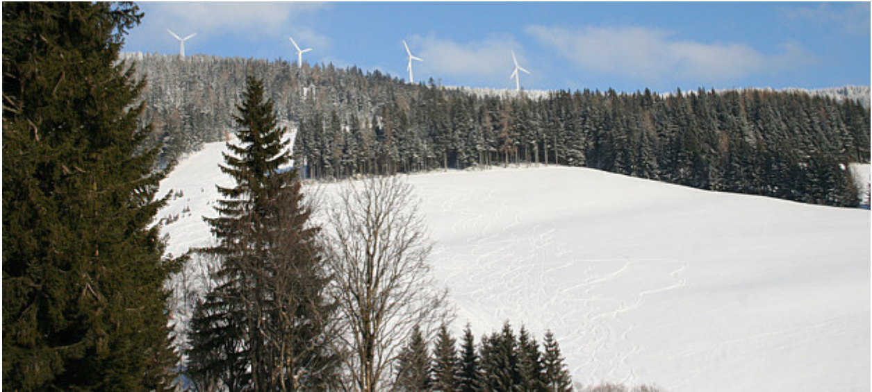
Blick vom Ausgangspunkt zum Windpark am Steinriegel