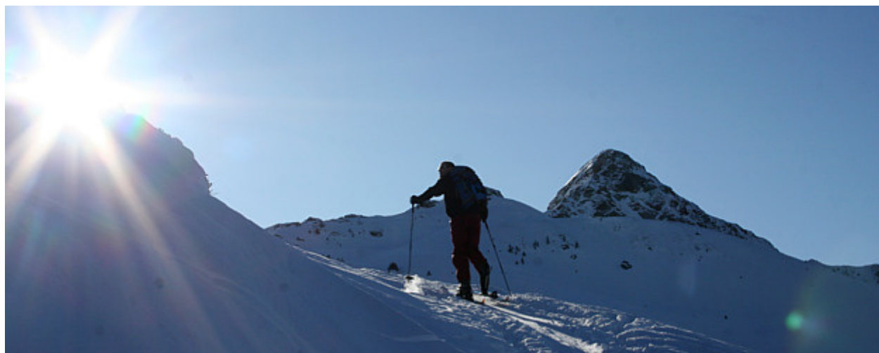
Im Aufstieg zur Sonnspitze, die ihrem Namen alle Ehre macht ... (rechts der Staffkogel)