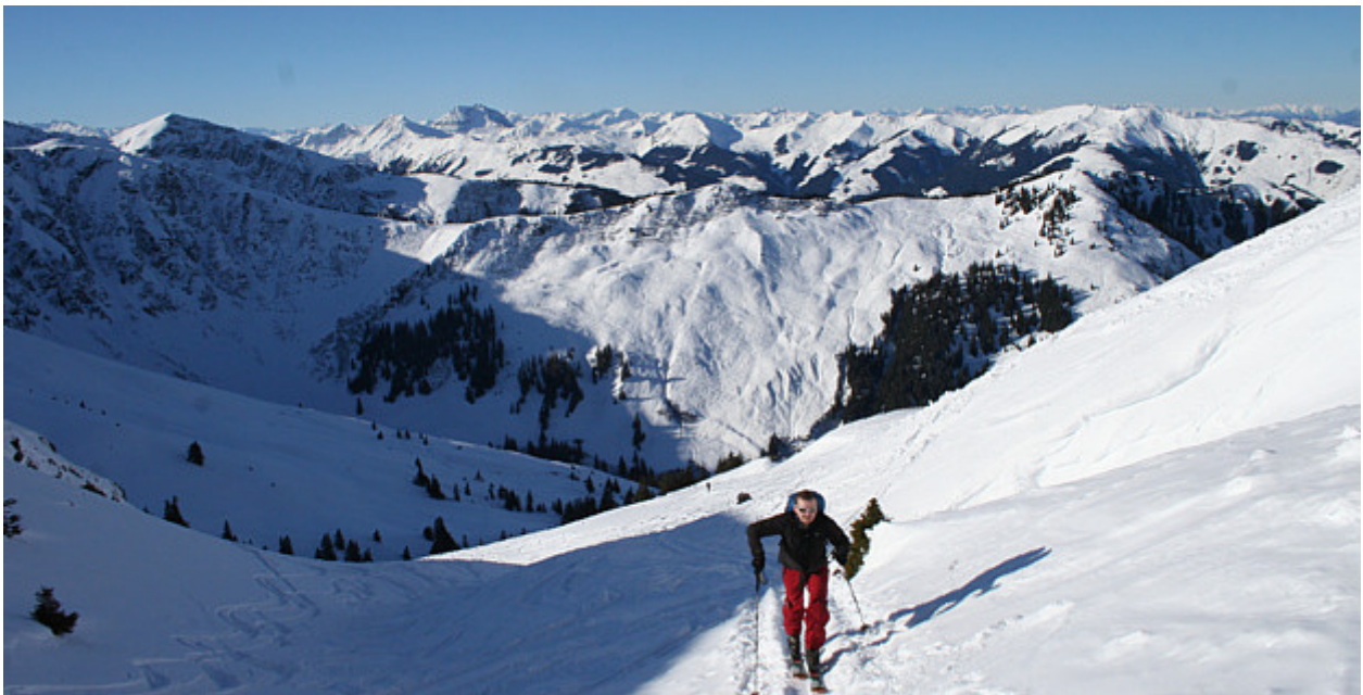
Über der Sonnenfelderalm, wenig unterhalb des Gipfelaufbaues