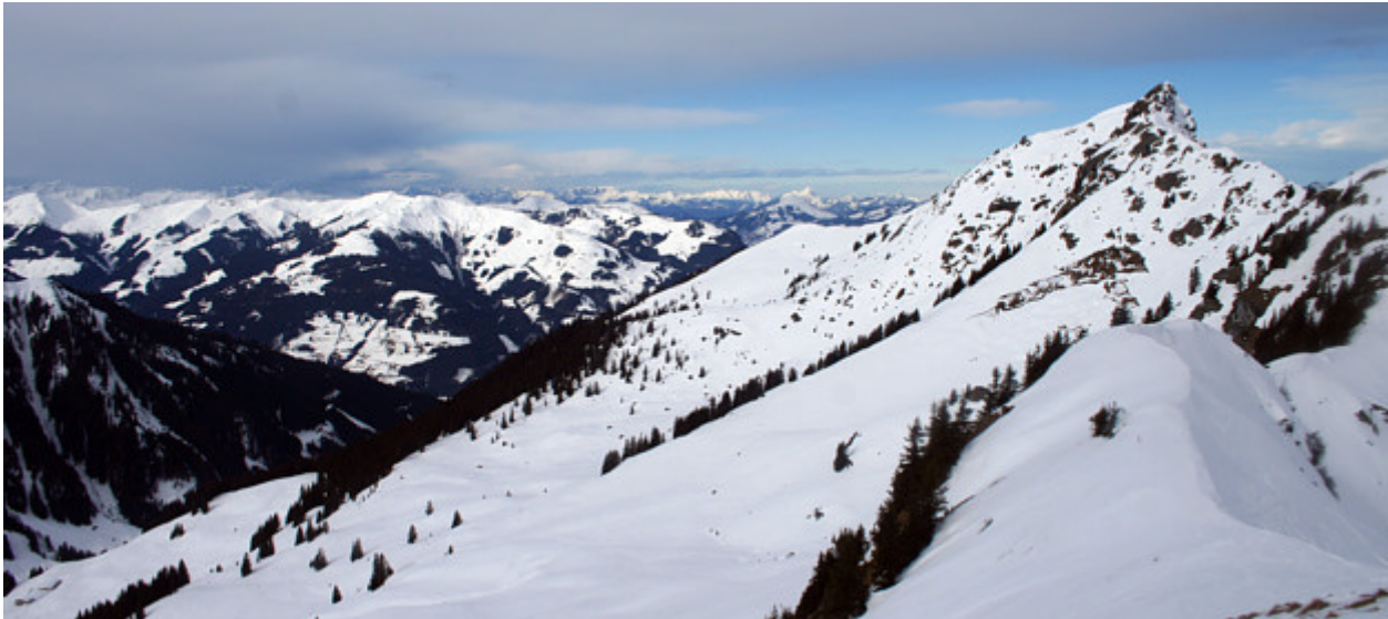
Der Große Gebra, aufgenommen aus südöstlicher Richtung