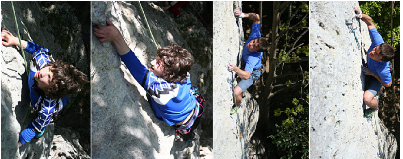
Zweimal Pegasus (6+/7-) links und zweimal Superfinish (8-) rechts, zwei der vielen tollen Routen am Sauzahn