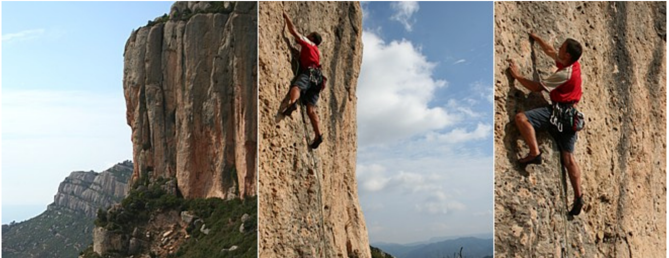
Im Sektor Racó de Missa, in zwei namenlosen Routen (7+ und 8-)

Costa Daurada - Spanien Serra del Montsant