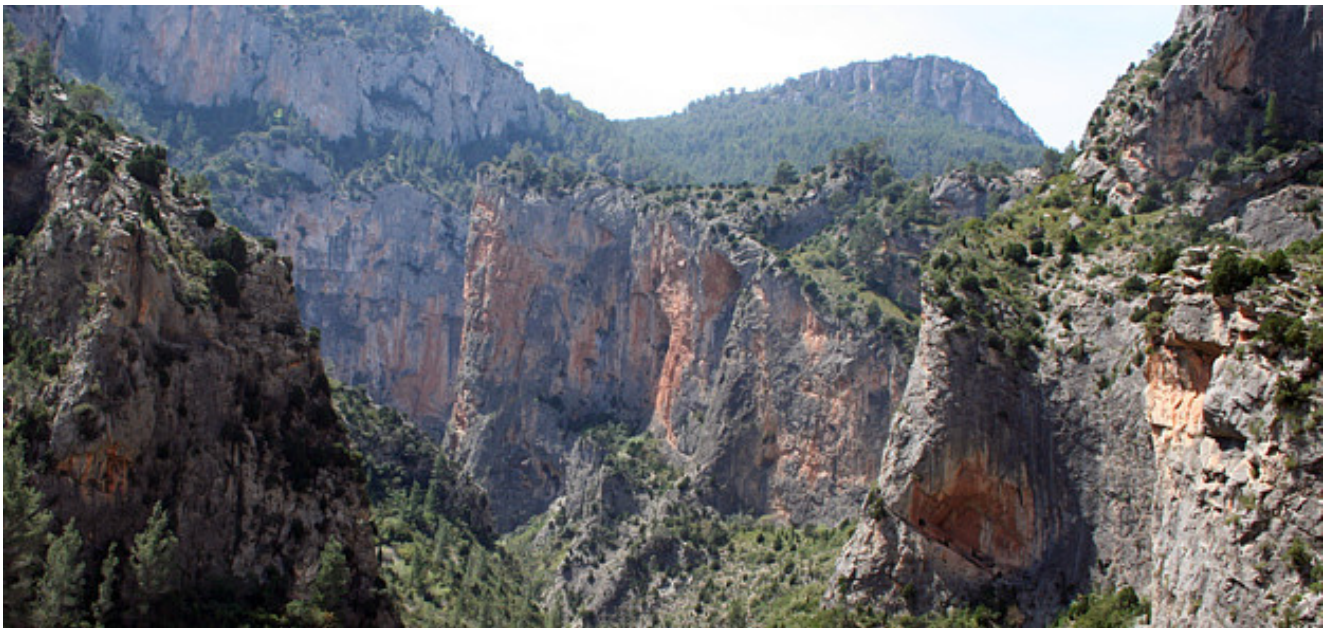
In der Barranco de la Maimona, in der Bildmitte der markante Espolón de la Catedrales