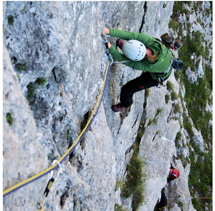
In der steilen Platte der 2. Seillänge