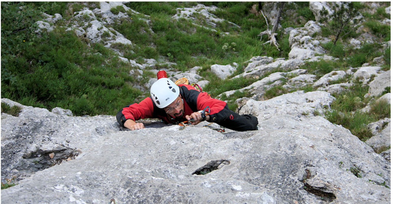
Im fantastischen Plattenfeiler der Ausstiegslänge (6+)

Der „King Kong Karl“ befindet sich im linken, gestuften Wandbereich. Zwei grasige Abschnitte in der ersten und fünften Seillänge stören nicht wirklich, der Rest der gut abgesicherten Route führt durch meist sehr henkeligen Plattenkalk.