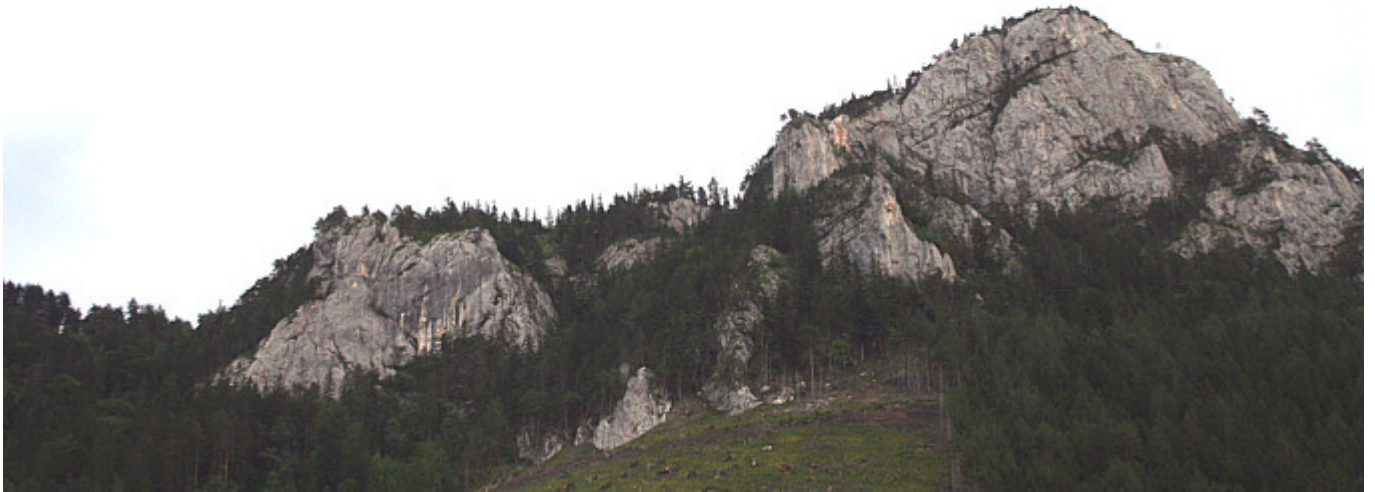
Rechts der Falkenstein und ganz links die Frisbeeplatte