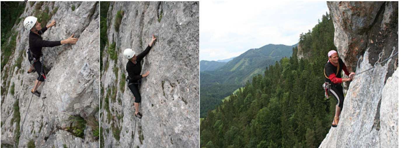
Links & mitte: Kuh Ros´l in der Materialeilbahn (1. SL; 5-) - Rechts: Einsatz des Prototypen (2. SL; 5-)

Die südseitige Ausrichtung der Wand und die einfache Erreichbarkeit der Wand sind zusätzliche Bonuspunkte des Gebietes. Wer also sowieso schon einmal im Höllental zwischen Schneeberg und Rax unterwegs ist, sollte den Abstecher nach Schwarzau im Gebirge nicht scheuen