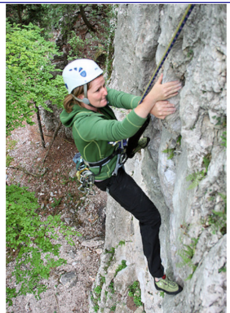
Am Ende der 1. Seillänge