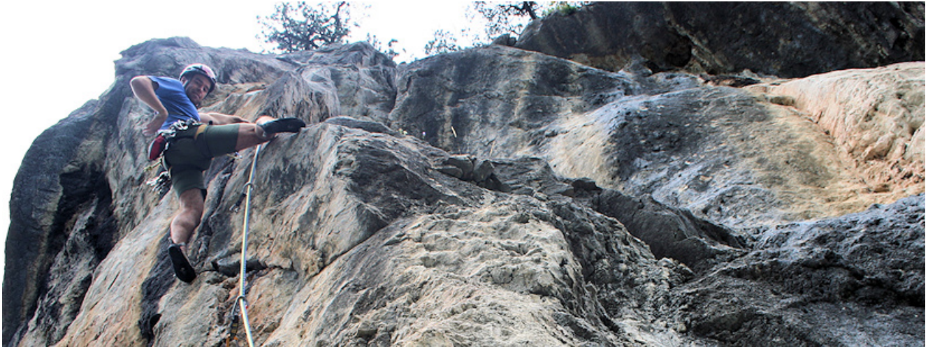
In der steilen 3. Seillänge

Der Verlorene Turm beherbergt einige fantastische kurze Mehrseillängentouren, dazu zählt auch die Route „Die Geister die ich rief“. Die Tour ist sehr gut mit Bohrhaken und Bühlerhaken abgesichert und bis auf eine splittrige Passage zu Beginn der 2. Seillänge ist der Fels hervorragend. Die Kletterei selbst ist meist sehr steil und stellt Ansprüche an die Ausdauer.