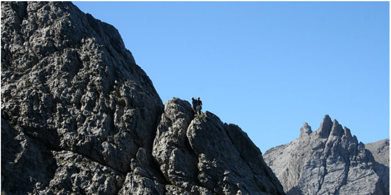
Eine Seilschaft im unteren Drittel der Bügeleisenkante

Eine Besonderheit dieser Route ist die Absicherung mit nahezu 60 Theniushaken (einer Entwicklung des Lienzer DI Alfred Thenius), an und für sich sind diese so konstruiert, dass ohne Expresschlingen bzw. Karabiner gesichert werden könnte. Es empfiehlt sich aber dennoch einige Bandschlingen bzw. Expreßschlingen mitzunehmen, da die sonst auftretende Seilreibung recht unangenehm werden könnte.