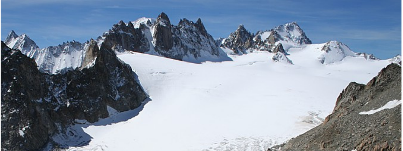
Blick von der Aiguille d'Orny über das Trient Plateau

Nach der Auffahrt mit dem Sessellift nach la Brea (Hin- u. Rückfahrt 14,- Franken – Stand 2006) entlang des gut markierten und bezeichneten Steiges in einer langen Querung der steilen Osthänge oberhalb des Combe d'Orny (teilw. mit Ketten versichert) in ein ebenes Kar, durch dieses aufwärts und entlang des Moränenrückens des Glaciers d'Orny aufwärts zur wunderbar gelegenen Cabane d'Orny.