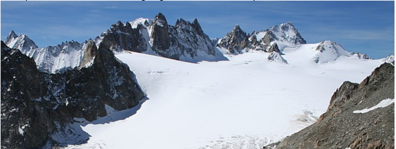
Blick von der Aiguille d'Orny über das Trient Plateau

Nach der Auffahrt mit dem Sessellift nach la Brea (Hin- u. Rückfahrt 14,- Franken – Stand 2006) entlang des gut markierten und bezeichneten Steiges in einer langen Querung der steilen Osthänge oberhalb des Combe d'Orny (teilw. mit Ketten versichert) in ein ebenes Kar, durch dieses aufwärts und entlang des Moränenrückens des Glaciers d'Orny aufwärts zur wunderbar gelegenen Cabane d'Orny.