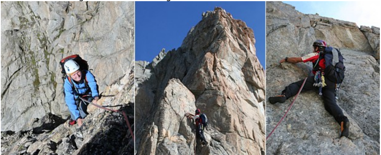
Im unteren Teil nahe der Kante (li.) - Übergang von der Schulter zur Gipfelwand (mi.) - In der Gipfelwand (re.)

Der Abstieg erfordert Aufmerksamkeit, ist aber aufgrund der ausgeprägten Steigspuren und der Markierung mit Steinmännern gut zu finden.