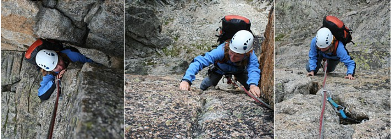
In der Rissverschnidung der ersten Seillänge (li.) und in der Gipfelwand (mi. & re.)